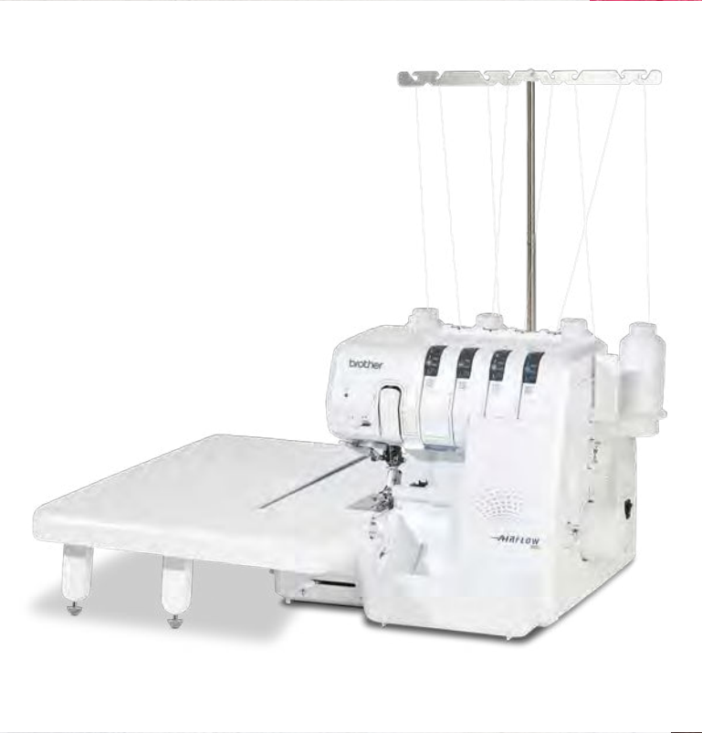
Optionaler Anstiebetisch (separater Kauf erforderlich)