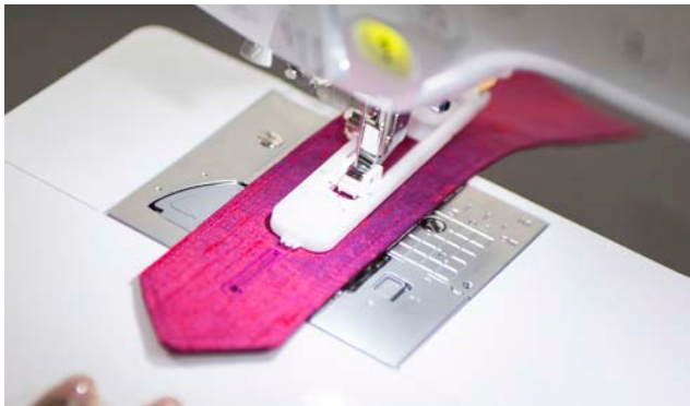
1-Stufen-Knopflochautomatik in 10 Varianten